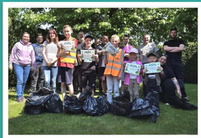
Le 9 mai : ramassage des déchets organisé par Bailleul'ains fête