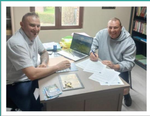
Le 6 mai 2026 : convention signée entre la commune et la Boule Bailleulaine