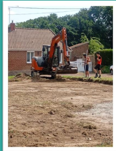
Début des travaux