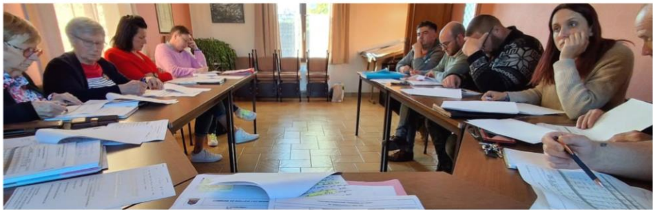
Le 29 avril : vote du budget de la commune