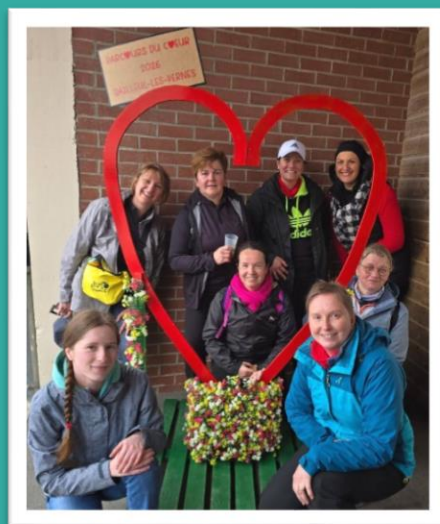
Le 17 mai : Parcours du cœur